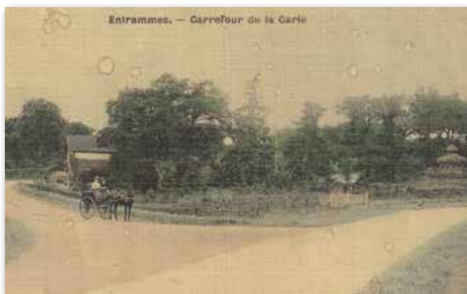
Le lieu-dit La Carie : selon l'habillement des personnages on peut dater d'environ 1910. Au verso, correspondance et adresse.