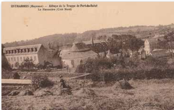
Abbaye d'Entrammes : Vue du monastère au début du XX ème siècle, peut-être dans un but publicitaire !