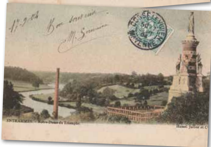
Notre Dame du Triomphe domaine de l'Abbaye du Port du Salut – photo prise de l'aval vers l'amont (direction Laval !!!). Aperçu de la cheminée de l'ancienne papeterie de l'île Sainte Apollonie – Carte affranchie en 1904 avec la correspondance sur le recto - au verso : uniquement l'adresse.