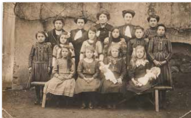
Photo représentant au recto, un cours de puériculture dans le village d'Entrammes (vraisemblablement ?) Au verso, correspondance et adresse.