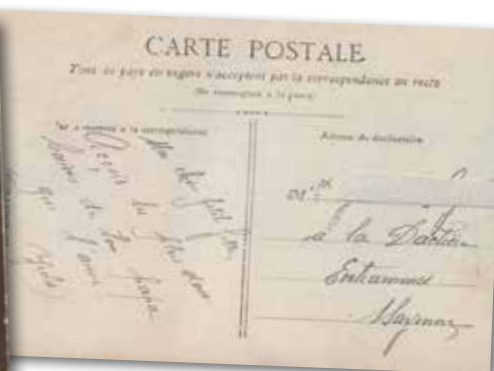
Modèle de carte envoyée par les soldats pendant la guerre 1914-1918 : Au recto illustration très fleurie et romantique. Au verso l'adresse et message d'un Entrammais à sa fille.