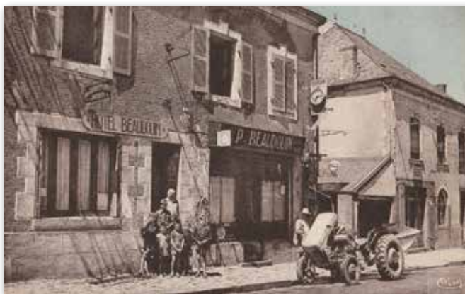
Hôtel Beaudoin : rue d'Anjou (année 1950 environ) Café-Restaurant-Hôtel tenu par M me Beaudoin et garage, distribution d'essence par M. Beaudoin.