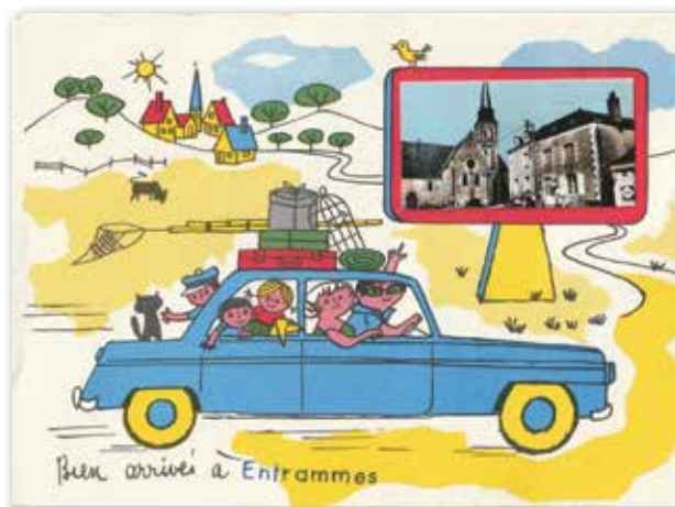
Carte humoristique (environ 1975) avec, en médaillon, une vue de la rue d'Anjou.