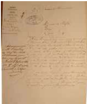
Acte écrit : carrière d'Ecorcé exploitation de pierre