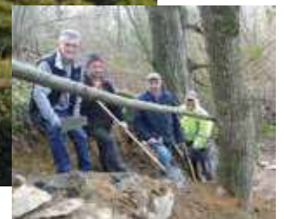
Carrière de la Roche, aménagement d'un chemin pédestre