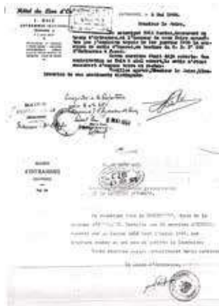
Acte écrit : carrière d'Ecorcé exploitation de pierre

La carrière servira de décharge sauvage pendant plusieurs années. Remise en état par la municipalité, avec l'aide des associations entrammaises et Mayenne Nature Environnement, Un chemin de la nature y est ouvert actuellement. (sur ce dernier sujet, un dossier vous a été proposé en décembre 2008 dans le bulletin municipal n°19)