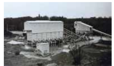
Carrière en fonctionnement 1989-90