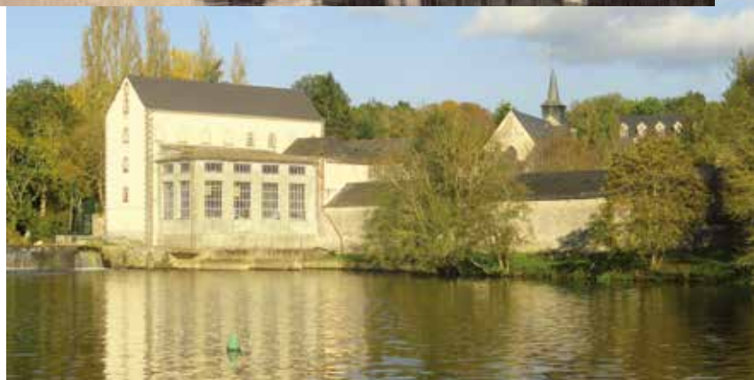
Construction d'une centrale électrique.