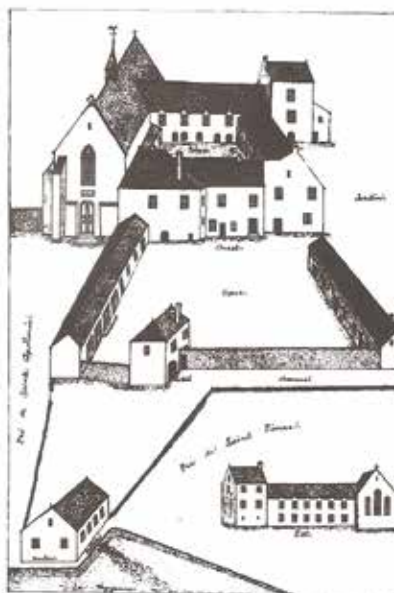
Extrait: Plan de Port du Salut, tel qu'il fut d'après Trappist (1815).

Dom Bernard (1815-1830) est élu prieur le 1 er août 1815. Le prieuré de Port Ringard est érigé en abbaye ND de Port du Salut le 10 décembre 1816. L'abbaye prospérait et le nombre de religieux